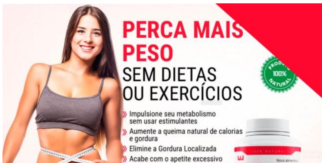
Figura 1: Exemplo 1 de propaganda na internet

Se utilizando desta oportunidade do consumismo e das dificuldades que as pessoas tem sobre a sua própria imagem, Barros (2014) afirma que as organizações farmacêuticas focadas nos emagrecedores, possuem investimentos altos em publicidade utilizando como ferramenta o marketing digital para apresentar aos clientes interessados, as hipervantagens destes medicamentos e omissão dos efeitos adversos e riscos que os mesmos podem causar ao fazer o seu uso sem acompanhamento médico. Os autores Couto (2000) e Maldonado (2006), concordam que o seguimento da moda, incentiva a busca pelo corpo perfeito, principalmente naquelas pessoas que tem problemas com a sua autoimagem; consumidores que buscam algum tipo de informação nas plataformas digitais relacionados a perda de peso, terá como retorno uma infinidade de informações disponível sobre este assunto, desde dietas, programas alimentares e até medicamentos disponíveis; para Huertas; Urdan (2004) as propagandas são carregadas de apelo emocional, justamente para estimular o consumismo; podendo ver observada esta condição no exemplo da Figura 1 e 2.